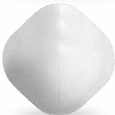
MASCHERINA RIUTILIZZABILE - BIANCA

Mascherina facciale in tessuto (Polipropilene e Cotone) 100% RIUTILIZZABILE. Struttura elastica e resistente. Lavabile a 90° Tessuto non irritante. Disponibile in 4 colori. INTERNO: 100% COTONE ESTERNO: 100% POLIPROPILENE