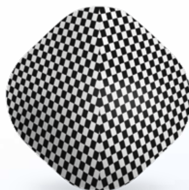
MASCHERINA RIUTILIZZABILE - SCACCHI