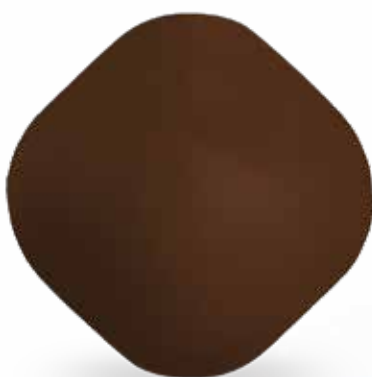
MASCHERINA RIUTILIZZABILE - MARRONE