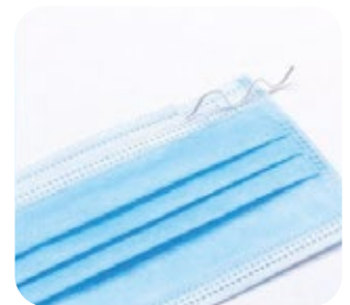
CLIP DI REGOLAZIONE PER GARANTIRE UNA PERFETTA ADERENZA AL VISO

STRATO ESTERNO RIVOLTO VERSO L'ESTERNO Strato antibatterico di tessuto non tessuto