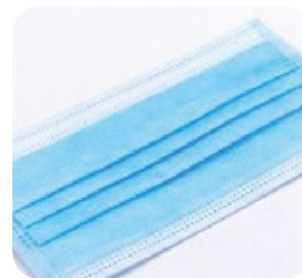
NON IRRITA LA PELLE