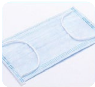
ELASTICI AD ALTA RESISTENZA